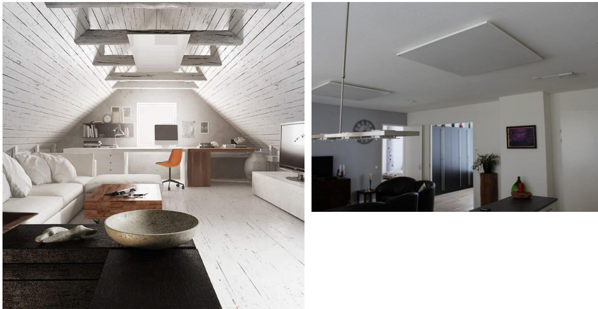
Figuur 1 Infrarood stralingspanelen aan het plafond