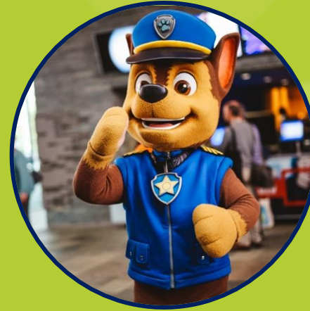
Meet & Greet