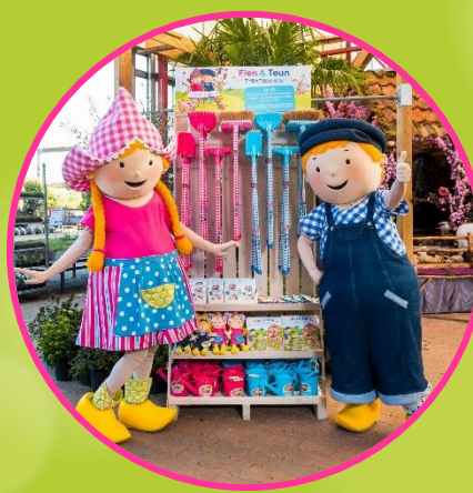
Retail en Merchandise